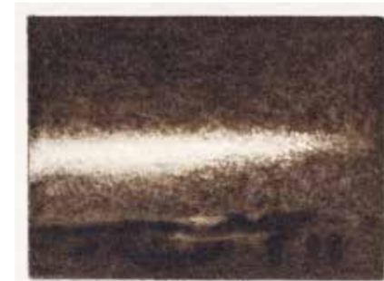
DUO NONGKRAN PANMONGKOL/LEXA PEROUTKA → Reborn Rage , 2022 flomaster na papíře, 297 × 210 mm